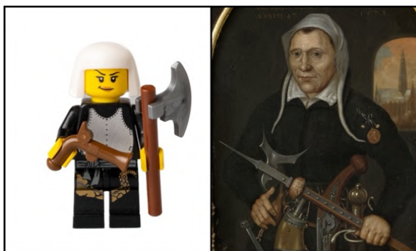
Kenau Simonsdochter Hasselaer

De opstand werd in eerste instantie door de Spaanse Hertog van Alva meedogenloos de kop ingedrukt. Slechts enkele delen van Holland en Zeeland hielden nog stand. Haarlem werd bijvoorbeeld zeven maanden lang belegerd door de Spanjaarden waar Kenau Simonsdochter Hasselaer een belangrijke rol speelde in de Haarlemse opstand.