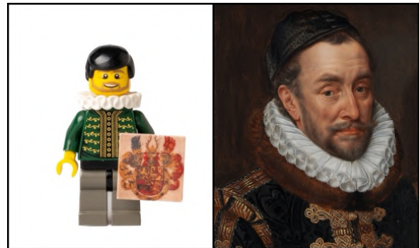
Willem van Oranje

Het is het jaar 1573 en de Tachtigjarige Oorlog is in volle gang. Opstandige Nederlandse gewesten onder leiding van Willem van Oranje zijn in opstand gekomen tegen de Spaanse koning Filips de II, die Nederland al jaren bezette. Het begon met een opstand tegen de onderdrukking van protestanten, maar groeide uit tot een oorlog die ging over vrijheid en onafhankelijkheid van Nederland.