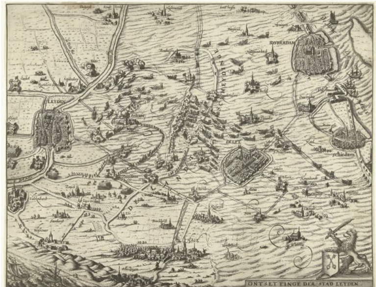
Ets van het water wat rondom Leiden de polders inloopt (anoniem 1623/1625)

Want in de nacht van 2 op 3 oktober begonnen de polders door een storm opeens heel snel vol te lopen. Toen een deel van de Leidse stadsmuur bij de Koepoort met veel kabaal instortte, raakte de Spanjaarden in paniek. Plots werden de Spanjaarden halsoverkop gedwongen om die nacht nog hun spullen in te pakken. Het hele leger van Valdez vluchtte, zo snel als ze konden, voor het snel stijgende water.