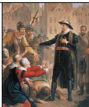
Pieter van der Werff