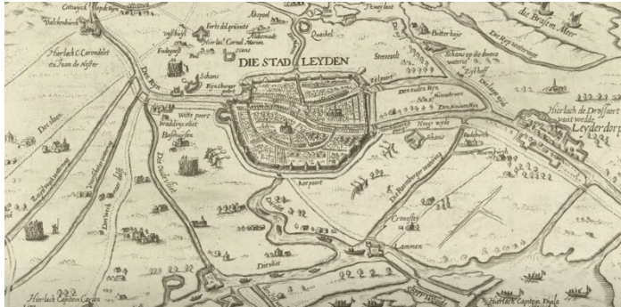
Gravure 'Beleg van Leiden 1574 (anoniem, 1625-1699)

Leiden was deze keer dus een stuk minder goed voorbereid en door voedseltekorten ontstond er al snel een flinke hongersnood. Voedselprijzen werden vastgezet zodat er