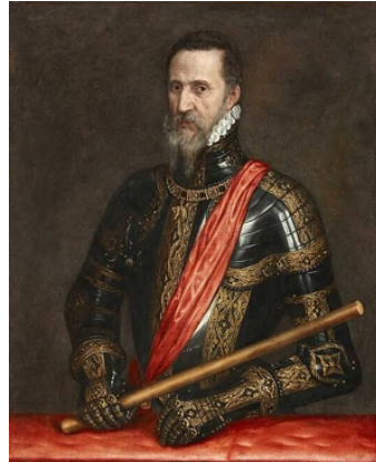
Hertog van Alva (Willem Key, 1568)

De Hertog van Alva gaf in oktober 1573 de Spaanse generaal Francisco de Valdez de opdracht om Leiden te veroveren. Het bestuur van Leiden, onder