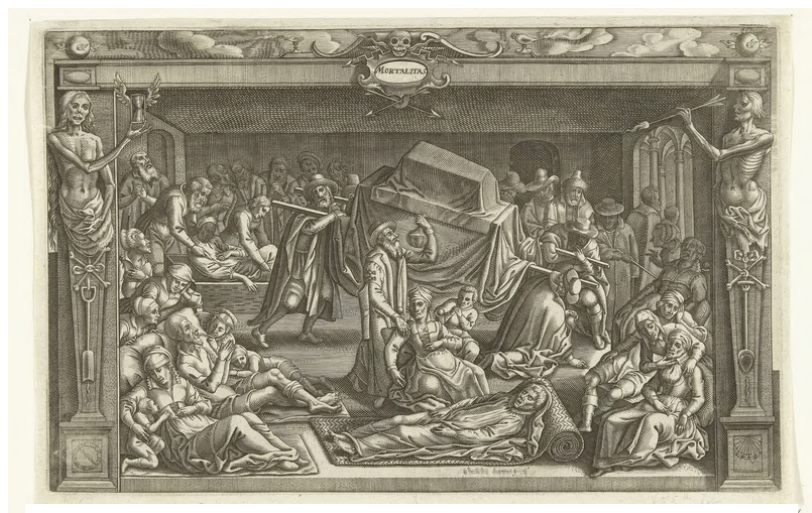
Sterfte door ziekte en pest onder de Leidenaren (Willem de Haen, 1612/1614)

De hongersnood en de pestepidemie bereikten een hoogtepunt en ook de militaire leider van Bronkhorst overleed. Continu overlegde het stadsbestuur over oplossingen. De ideeën gingen van stug volhouden naar een volledige veldslag of zelfs overgave, maar een beslissing werd er niet genomen. Dat kwam