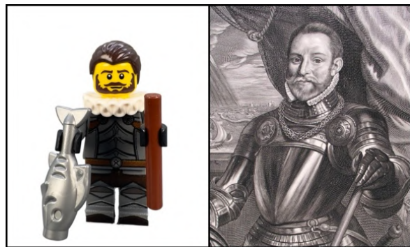
Lodewijk van Boisot

Maar er was hoop. Op 28 september 1574 hoorden de Leidenaren, via de komst van brieven die door postduiven waren gebracht, dat Willem van Oranje en de watergeuzen onderweg waren. De Leidenaren moesten nog even volhouden. De dijken waren doorgestoken met het plan om het gebied rondom de stad volledig onder water te zetten. Een plan met grote gevolgen, want ontzettend veel vruchtbaar land zou onder water komen te staan en daardoor jarenlang niet bruikbaar zijn als landbouwgrond. Er werd door de watergeuzen een vloot van 320 boten samengesteld onder leiding van admiraal Lodewijk de Boisot en duizenden soldaten stonden klaar. Met deze boten wilden de geuzen de stad bevrijden en voeden. Maar het plan mislukte, de dijken werden wel doorgebroken maar doordat de wind verkeerd stond, kwam het water niet meteen bij Leiden.