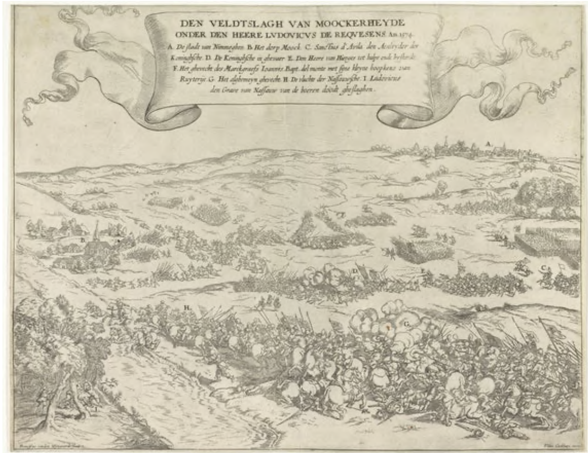
Het leger van Lodewijk van Nassau in gevecht (Johann Wilhelm Baur, 1643-1645)

Willem van Oranje wilde de stad wel bevrijden, maar zijn eigen leger was te klein en de Spaanse troepen hadden zich goed verschanst. Daarom vroeg hij zijn broer Lodewijk om een afleidingsmanoeuvre te creëren. Valdez hoorde dit en stopte met de belegering van Leiden om ten strijde te trekken tegen Lodewijk.