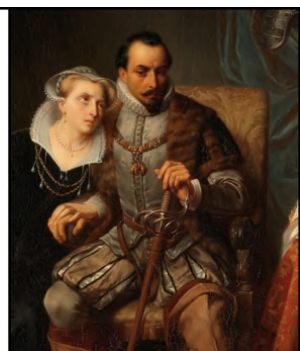
Francisco de Valdez